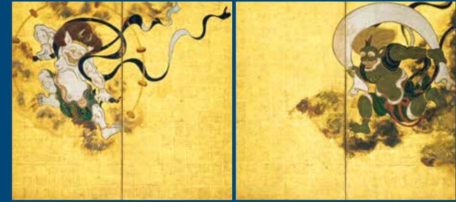
世界に向けた日本美の顔、「琳派」の祖。 国宝 風神雷神神図屏風 依屋宗達筆 江戸時代 17世紀 京都・建仁寺所蔵 【通期展示】

富嶽三十六景 葛飾北斎画 江戸時代 天保2年(1831)頃 掲載作品は前期展示の山口県立萩美術館・浦上記念館所蔵 後期は和泉市久保記念美術館所蔵を展示