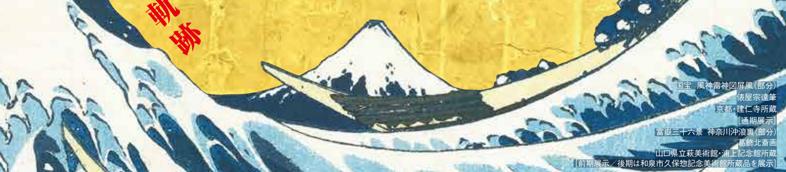
国宝 風神雷神図屏風(部分) 依屋宗達筆 京都・建仁寺所蔵 [通期展示] 富嶽三十六景 神奈川沖浪裏(部分) 葛飾北斎画 山口県立萩美術館・浦上記念館所蔵 [前期展示 / 後期は和泉市久保記念美術館所蔵品を展示]