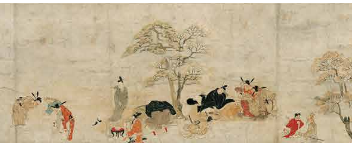
吉備大臣入唐絵巻 巻第四(部分) 平安時代 12世紀 米国・ボストン美術館所蔵 【通期展示】

重要文化財 鳥獣文様綴織陣羽織 豊臣秀吉所用 桃山時代 16世紀 京都・高台寺所蔵 4月19日~5月11日展示