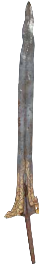
クリス インドネシア 16~17世紀 京都・石清水八幡宮所蔵 【通期展示】